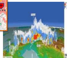
線状降水帯の雨雲構造