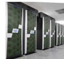
ゲノムデータベース KEGG