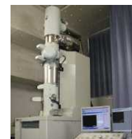
高機能電子顕微鏡群