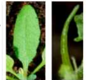
野生型シロイヌナズナの扁平な葉 表裏の分化ができないシロイヌナズナの棒状の葉

・葉は、茎の先端の成長点にある幹細胞から分化する地上部の主要な光合成器官である。発生初期の葉は表・裏がなく棒状だが、発生と共に表・裏の構造ができ、扁平な葉がつくられる。表・裏のいずれかの細胞の分化がうまくできないと、葉は棒状のままである(図参照)。このように、葉の形成において、AS1とAS2があると、多少生育条件が悪くても葉を展開できる事がわかり、AS1-AS2が環境変化に強い植物をつくるための守護神であることが判明した。