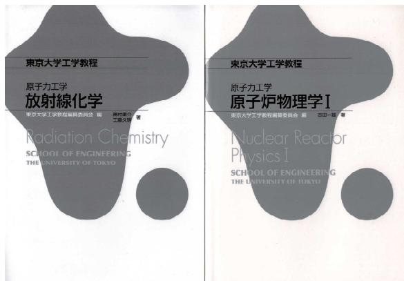
工学教程 (1) 「原子炉物理学 I」と「放射線化学」 学生用試用版各 500 冊を刊行した。

平成 25 年度はウィーン工科大学 (オーストリア)、ミシガン州立大学 (アメリカ) に計 2 名を派遣。平成 26 年度は IAEA (オーストリア) に 1 名を派遣。平成 27 年度は 1 名をウィーン工科大学 (オーストリア) に 1 名を派遣。