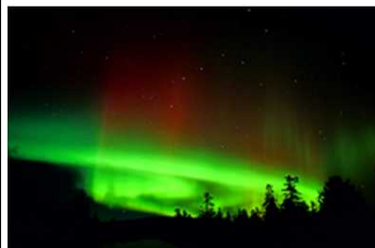
地上から見たオーロラ爆発