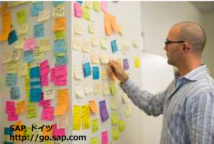
SAP, ドイツ http://go.sap.com