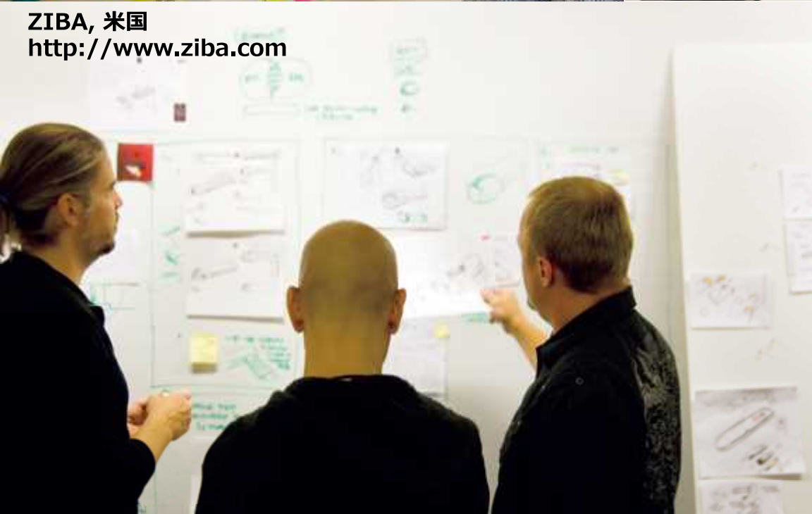
ZIBA, 米国 http://www.ziba.com