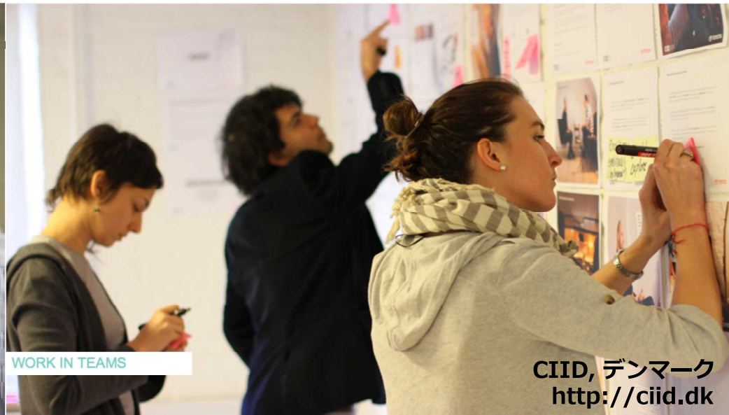
WORK IN TEAMS