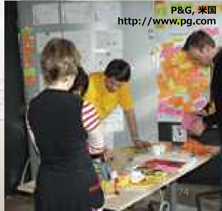
P&G, 米国 http://www.pg.com