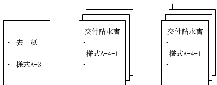
①若手研究 (A) 3件