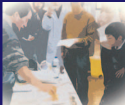
身近な場所へ出かけよう！

研究者ってなんとなく近寄りたいたい。でも何のために研究してるのか聞いてみたい気がする……。ならば、大学のオープンキャンパスや研究室公開へ行ってみよう！旬の研究動向を研究者から直接聞くことができるよ。もちろん質問OK。書店や科学館が開くサイエンスカフェも要チェック！お茶を飲みながら気軽に研究者とサイエンス談義に花を咲かせよう。