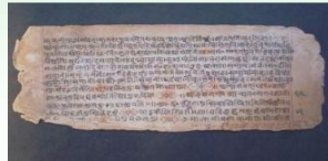
リグヴェーダ(古代インドの聖典)