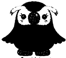
「エリカちゃん」 北方領土問題啓発キャラクター