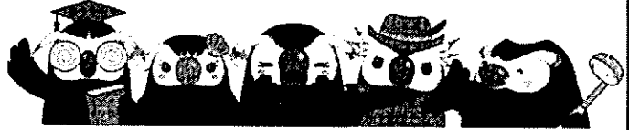
「エリカちゃん」とお友達