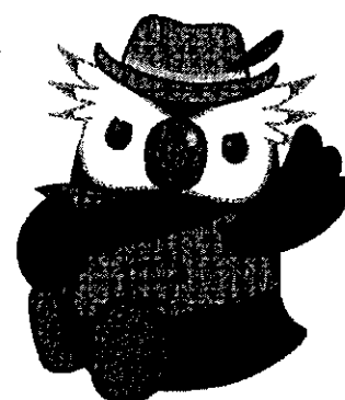
「エリカちゃん」のお友達の「エリオくん」