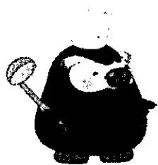
「エリカちゃん」のお友達の「エリマルくん」