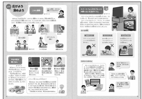
p.14 ~ 15