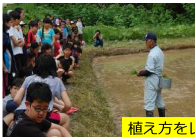
植え方をレクチャー