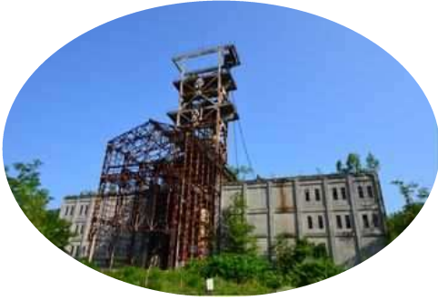
三笠ジオツアー明日 10/13