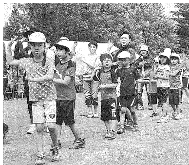
運動会で地域住民と一緒に「北海盆踊り」を楽しむ三笠小の児童ら

同校の教員が「運動会に記念イベント」と考え、三笠民間協会と三笠町町民会、三笠天鼓や関係団体に協力を依頼、体育の授業や放課後の通園かけて盆踊りや踊りを練習した。この日は、高橋に駆け付けた三笠の生徒を含む10人が、太鼓を叩きながら