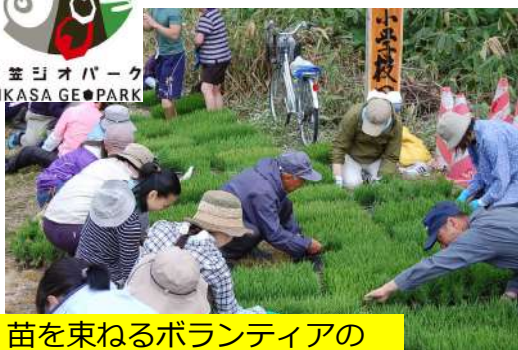
苗を束ねるボランティアのみなさん