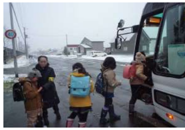
スクールバス乗車指導