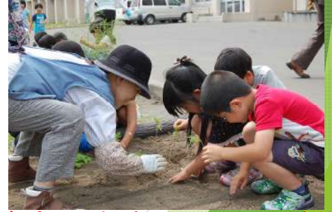
福寿会と1年生のコスモス植栽 三笠小中一貫CS委員会