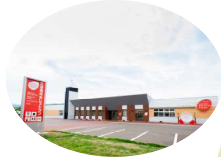
高校生レストラン