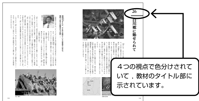
▲大きな紙面が迫力ある構成を可能にしています。 p.132～133

発達の段階や実態を重視し、魅力ある教材を選択、配列しています。また、すべての読み物が見開きで始まります。さらに、印象的な挿し絵や写真を適所に配置し、生徒が興味・関心をもって学習に取り組み、理解を深められるようにしています。