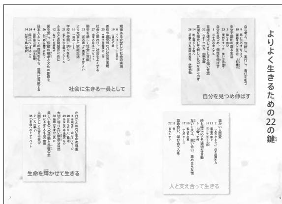
▲4つの視点で分類された教材の一覧を巻頭に設けています。 p.6～7

各所で4つの視点による色分けを明示し、見直しをもって学習に取り組めるようにしています。