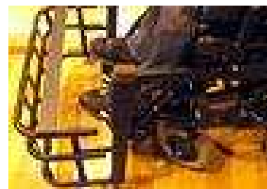
車椅子に装着するフットガード