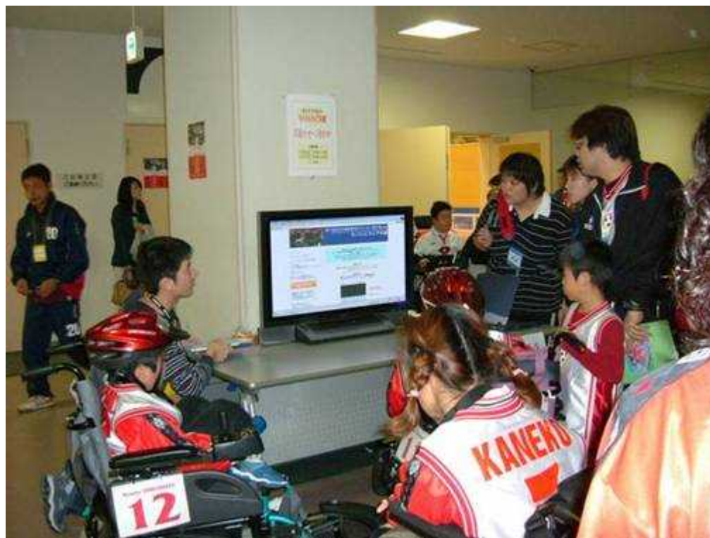
大会会場のロビーで展示