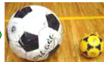
直径33cmの大型ボール