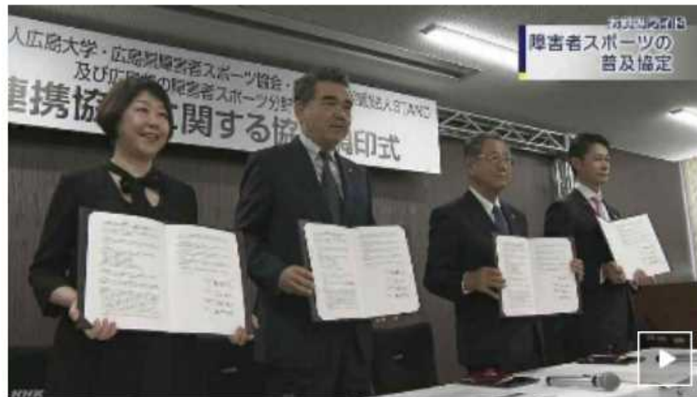
広島大学・広島県