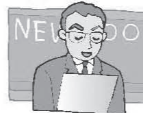
newscaster [ニュースキャスタ]