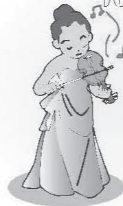
violinist [ヴァイオリニスト]