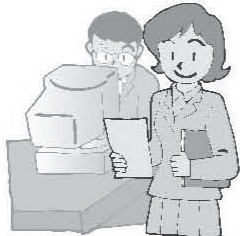
office worker [オーフィス ワ〜カ]