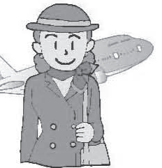
flight attendant [フライト アテンダント]