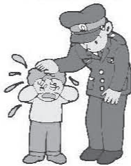
police officer [ポリース オーフィサ]