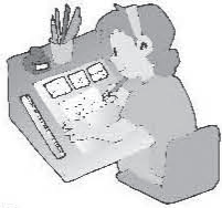
cartoonist [カートゥーニスト]