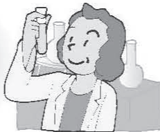
scientist [サイエンティスト]