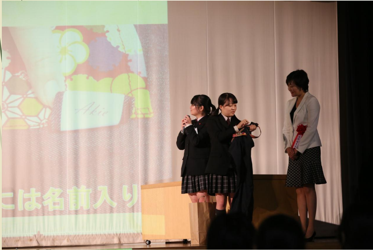
安倍晋三内閣総理大臣夫人 安倍昭恵様