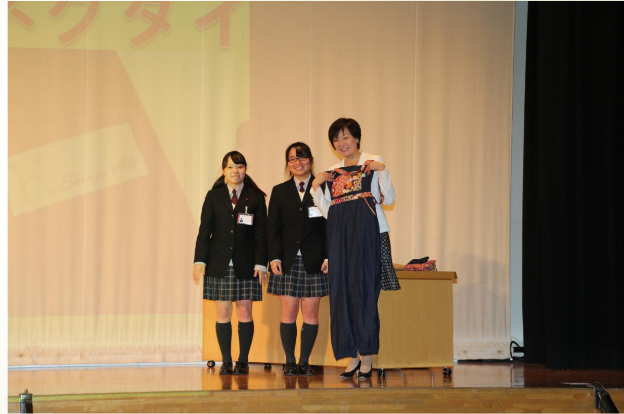
特別授業でのプレゼンテーションと贈呈