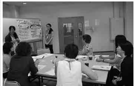
打ち合わせや会議の進め方、記録の仕方を学ぶための連続講座 及び それを実際にプロジェクトの会議で活かしている様子