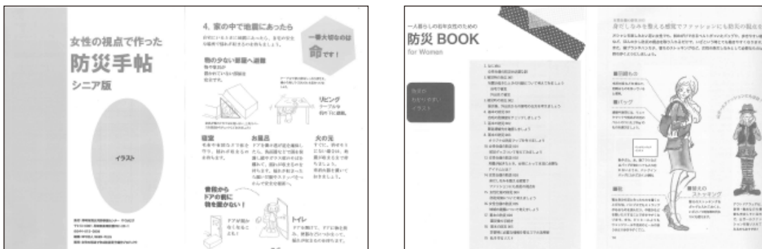
防災冊子の検討(左:シニア版、右:若年女子向け版) ※製作途中段階のものへの添削