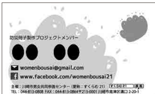
防災プロジェクトメンバーの名刺