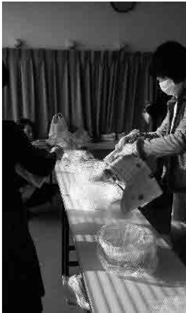
講座準備 (実験の様子)