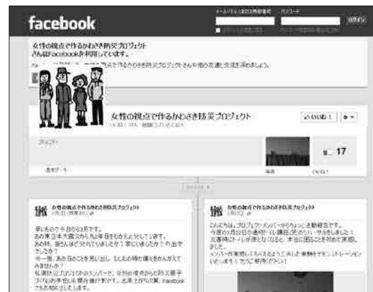
メンバーが作成しているフェイスブック