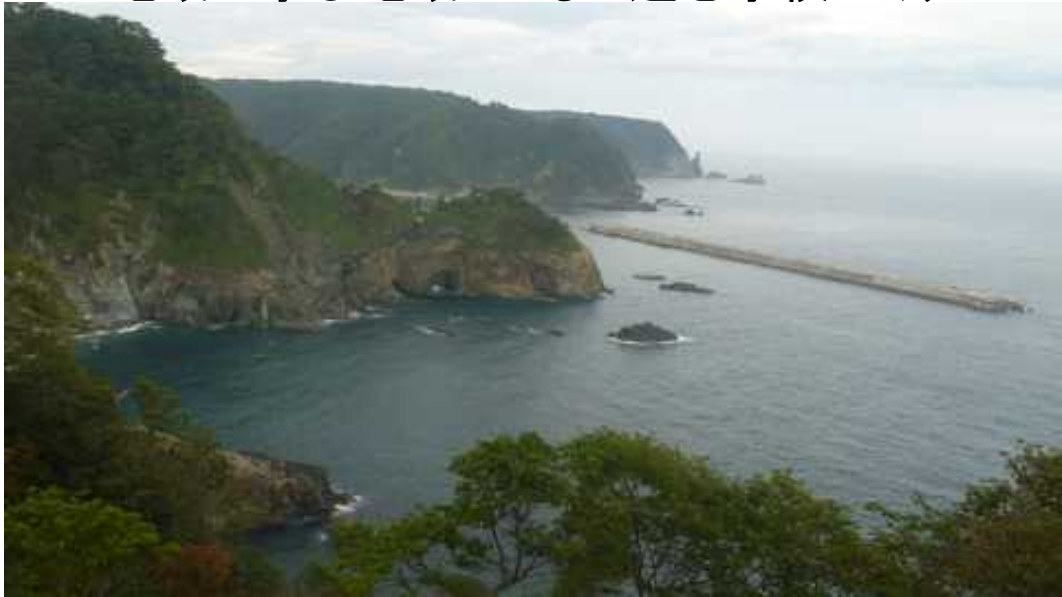
岩手県岩泉町立小本小学校