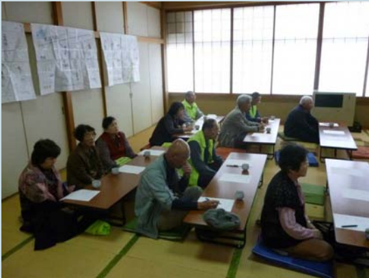
見守りタイとの連絡会