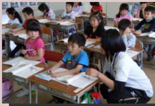
大学生の学習支援