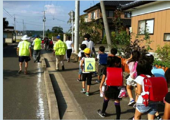
見守りタイに見守られて下校