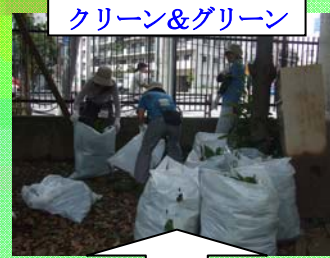
クリーン&グリーン

地域連携バザーを行い、その収益金で地域の誰でもが参加できるコンサートを行っています。