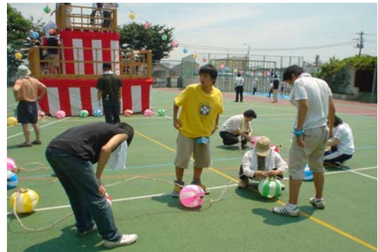
親子盆踊り大会の準備「中学生は地域の一員」青少年九品仏地区委員会の取り組み

世田谷区は平成9年度に全国に先駆けて「地域とともに子どもを育てる学校」の基盤となる「学校協議会」を組織し積極的に取り組んできたが、八幡中学校ではそれ以前から、町会や自治会、商店会、青少年委員、民生・児童委員等で構成される青少年九品仏地区委員会と、子どもの健全育成を図る取り組みがあった。具体的には、「八幡小学校親子盆踊り大会」「バスハイク」や「新春餅つき大会」の地区委員会が主催する地域行事に、生徒をボランティアとして参加させてきたことである。