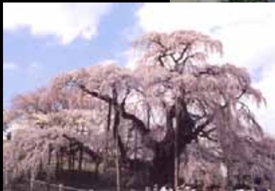
三春町立三春小学校