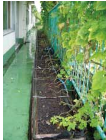
ベランダに設置されたプランター