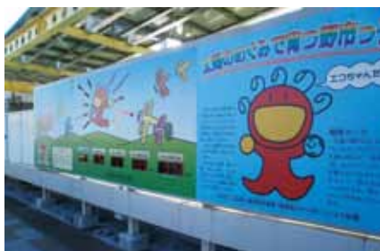
外周フェンスに設置した表示パネル