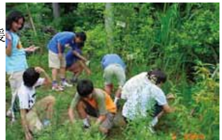
ビオトープ委員会の様子(平成14年度) 1