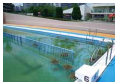
プールを利用したビオトープ