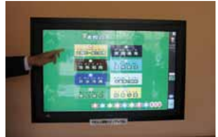
エコ表示モニター