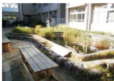
ビオトープ改修後（現在）