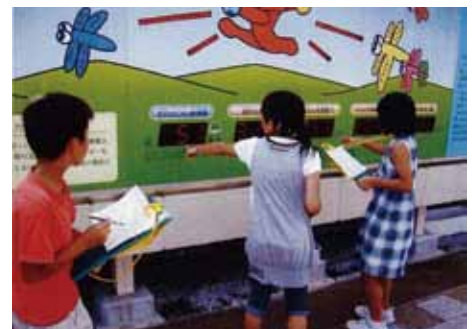
太陽光発電表示パネルによる学習