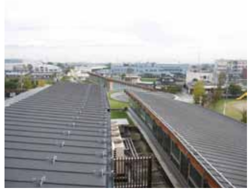
散水設備のある屋根