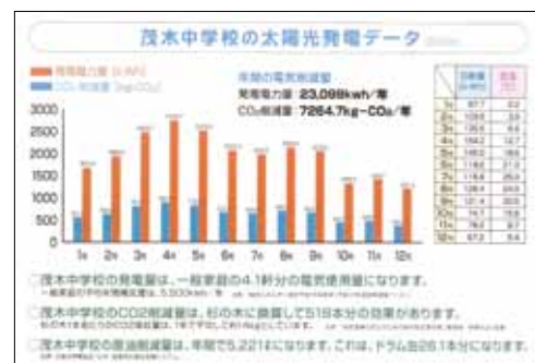
太陽光発電パンフレット（茂木町教育委員会作成）