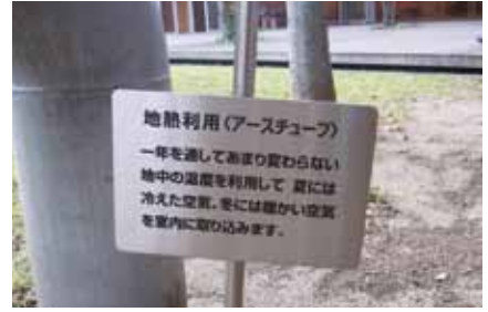
アースチューブ（左：吸気口、右：吹出口）