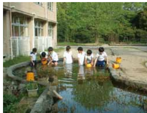
外来種（ウシガエル）の捕獲に挑戦