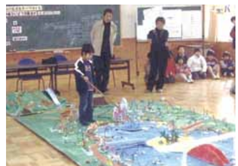
中庭改修のアイデア発表