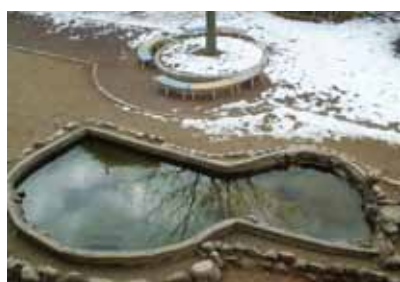
ビオトープ改修前（2005年12月）