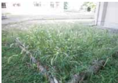
コオロギを呼ぶために陰地に作ったビオトープ（草を刈り残す）