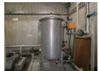
雨水タンク（中水利用）