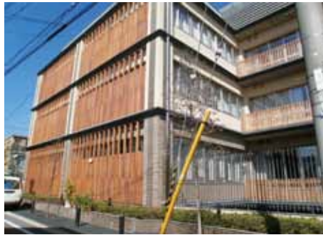
町並みに調和した外観（左）と周辺町並み（下）