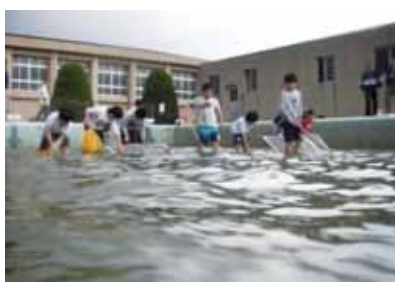
メダカを捕獲し市内の小学校に配布