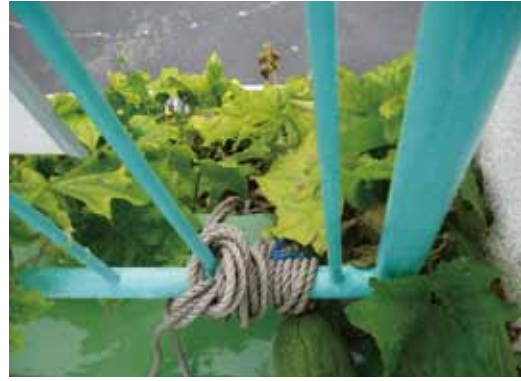
緑のカーテンのワイヤーとネット