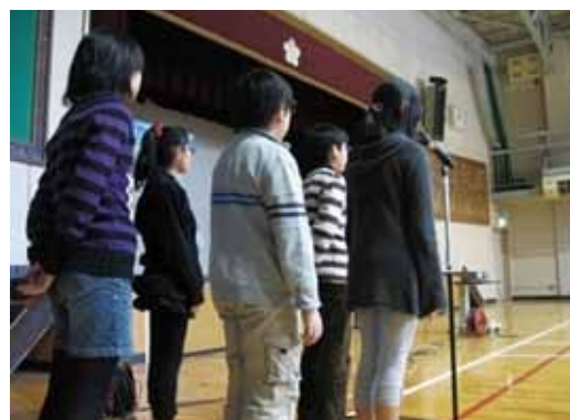
緑のカーテン学習発表会（平成21年度） 1