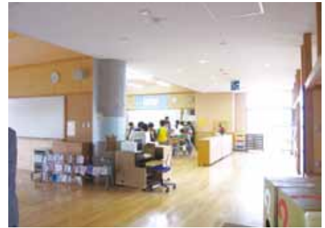
オープンスペースの明るい教室