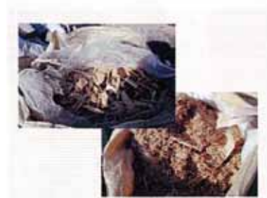
製材時に発生したオガ粉

製材の過程で発生したオガ屑や廃材を、有機物リサイクルセンターに搬入して有機肥料とし再利用を図った。