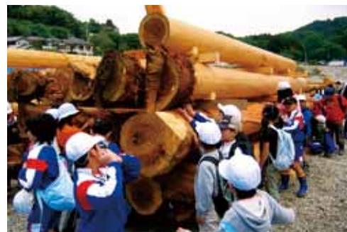
木材ストック場が屋外授業スペースに