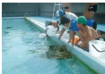
プールへメダカを放流