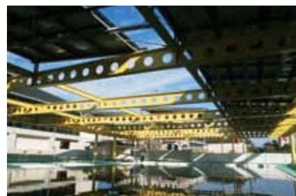
屋外プール屋根に設置した太陽光発電設備