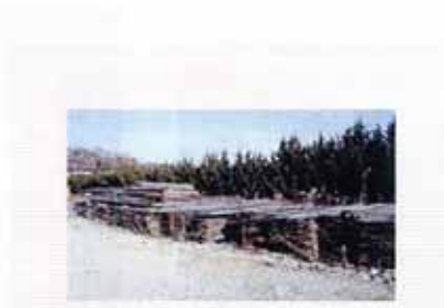
製材したバタ材もストック