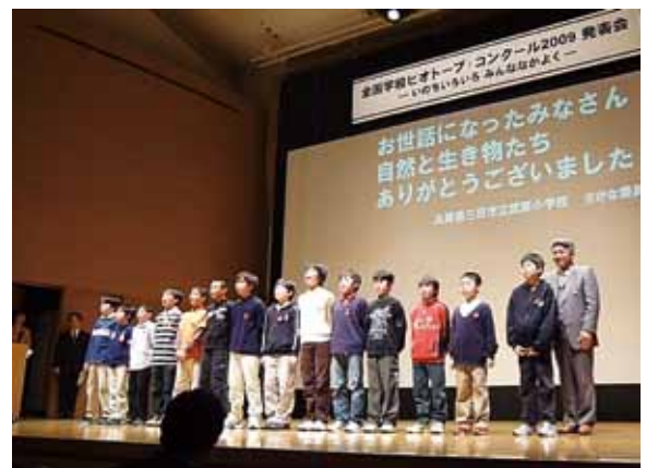
第6回全国学校ビオトープコンクール発表の様子