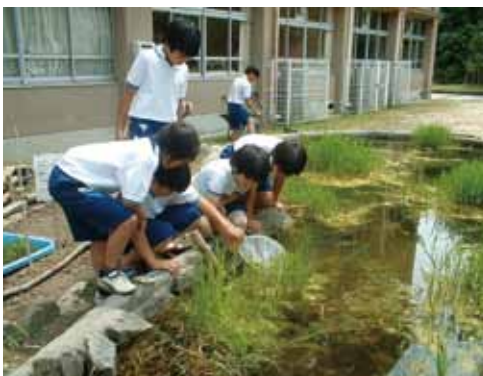
運動会の練習の合間も手入れ