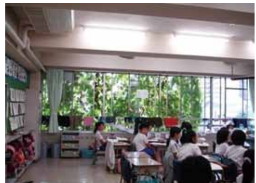
教室内部から見た緑のカーテン