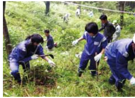
町有林の下草刈り