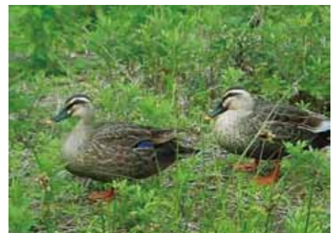
ビオトープの生き物 1