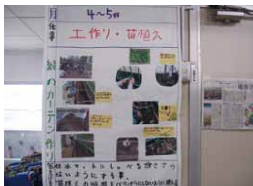
緑のカーテンづくりの学習