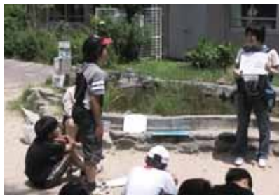
学習センター指導員との学習