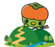
橋本市マスコットキャラクター「はしぼう」