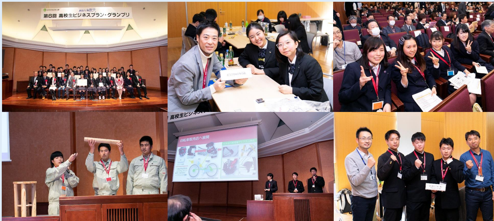
(会場／東京大学本郷キャンパス伊藤謝恩ホール)