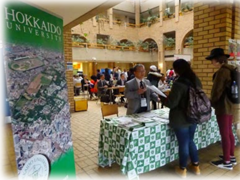
日本留学フェア@ケープタウン大学・南アフリカ