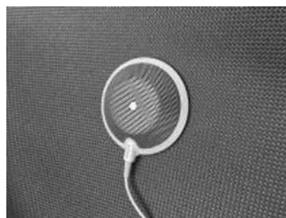
付属の無指向性マイク

遠隔授業の場合、スピーカーから出力する音響は人声がほとんどであるので、スピーカーは小型のものでよい。アンプを使用するときは片 ch 20～30W程度の出力があれば十分である。