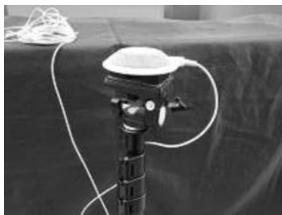
付属のマイクの細いコード 断線しないように神経を使った