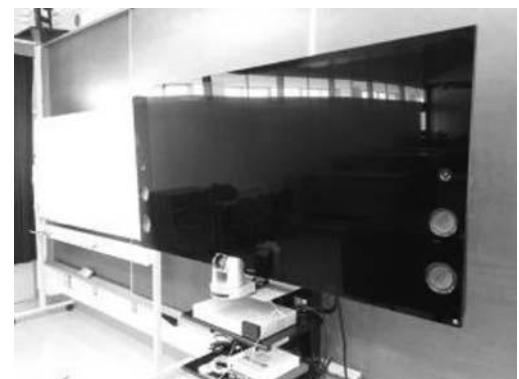
65型の4Kテレビ（高価だった）

今回ディスプレイは送受信共に65型の液晶テレビを選択した。また、データなどの投影は液晶プロジェクターを使用した。