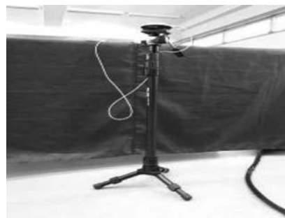
三脚を活用したスタンド

当初、カメラは三脚に固定し、三脚には「ドリー」（キャスターがついている）をつけて移動をスムーズにした。カメラが重いので、三脚は頑丈で重いものがよい。