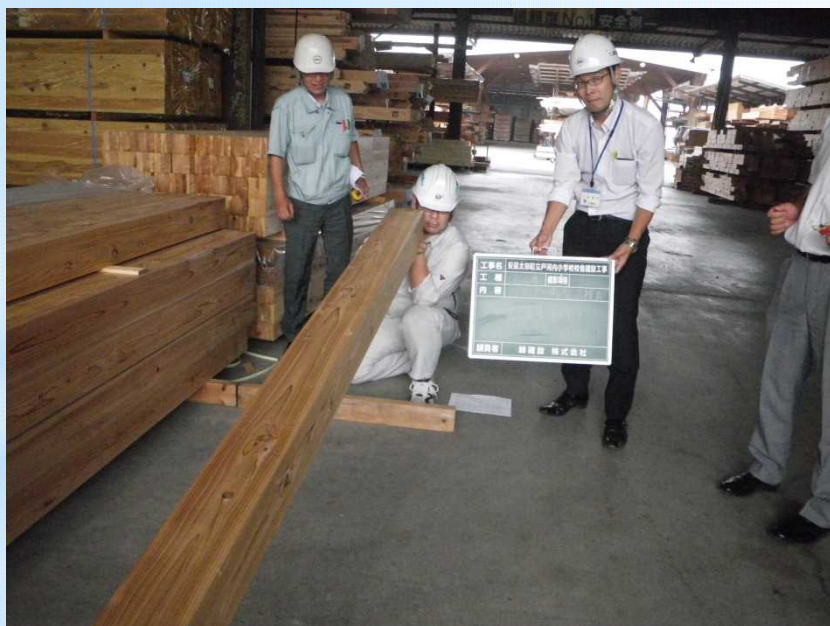
プレカット前 製品検査