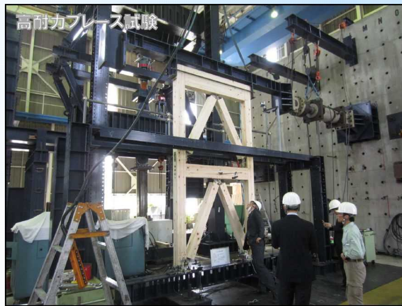
高耐久ブレース試験