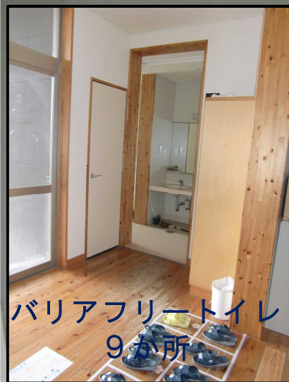
バリアフリートイレ 9か所