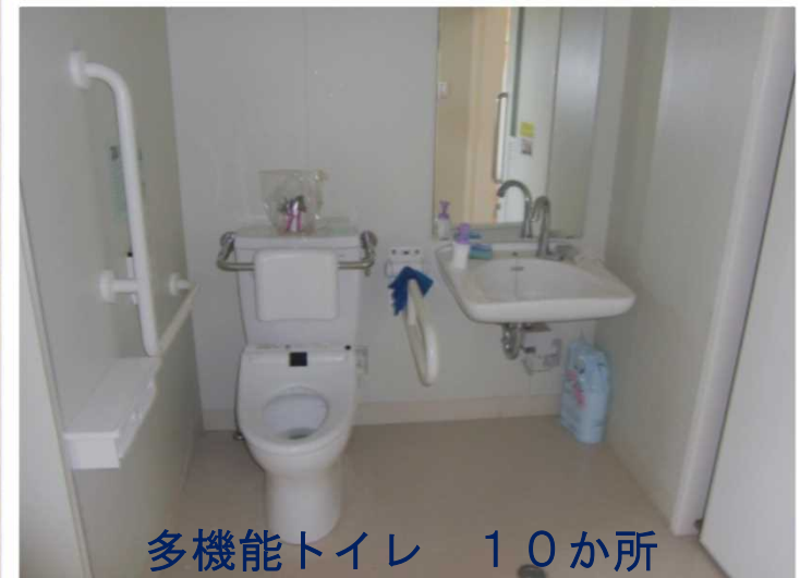
多機能トイレ 10か所