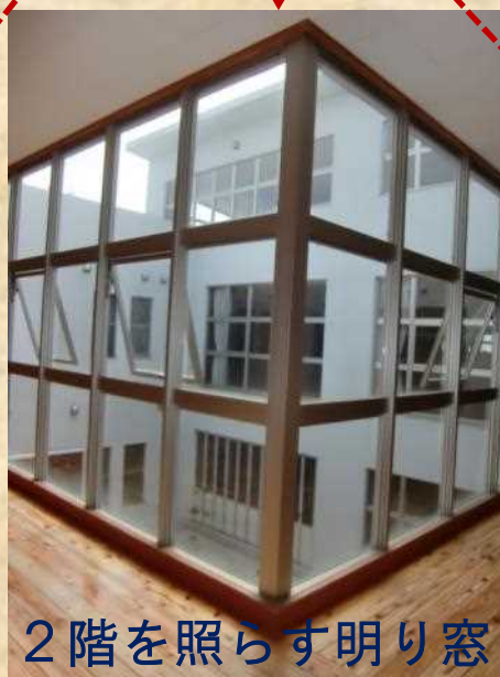
2階を照らす明り窓