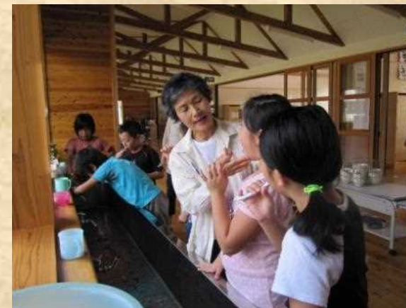
広い廊下で歯磨き指導