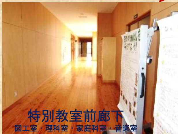
特別教室前廊下 図工室・理科室・家庭科室・音楽室