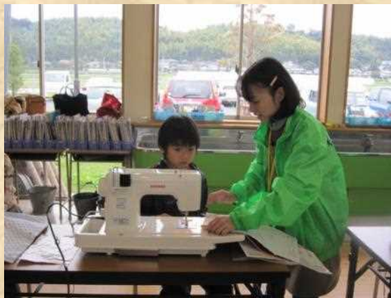
作業学習は廊下も活用