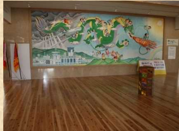
児童玄関壁画彫刻前ホール