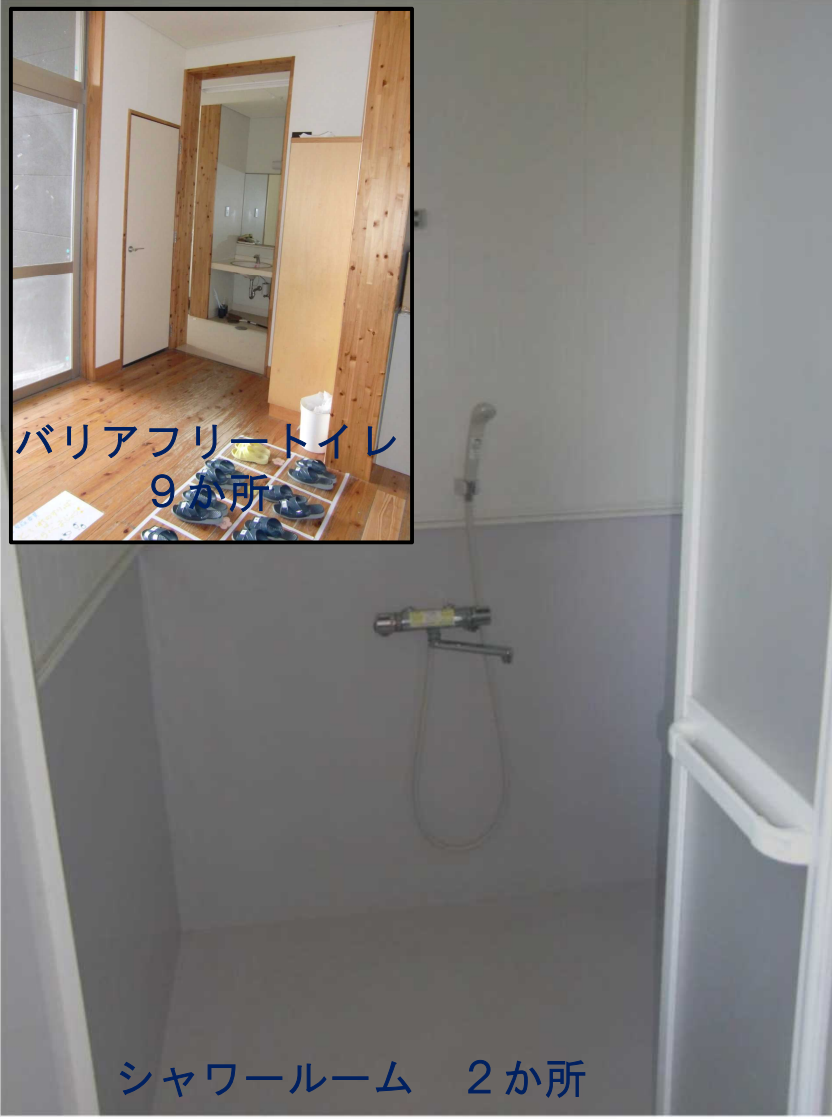
シャワールーム 2か所