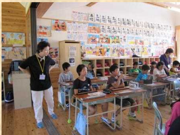
広い教室でのびのび授業