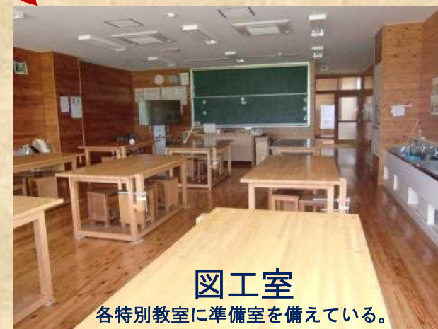
図工室 各特別教室に準備室を備えている。