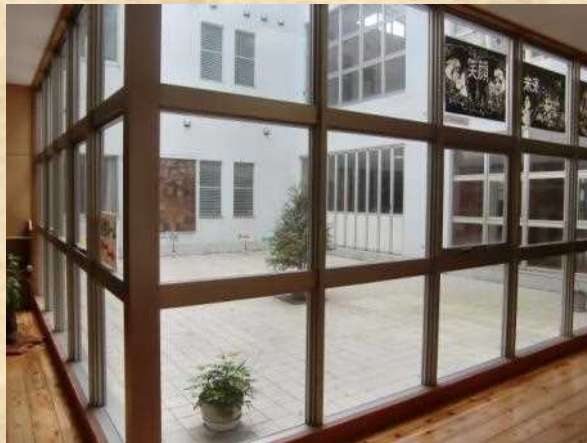
本館1階玄関前光庭