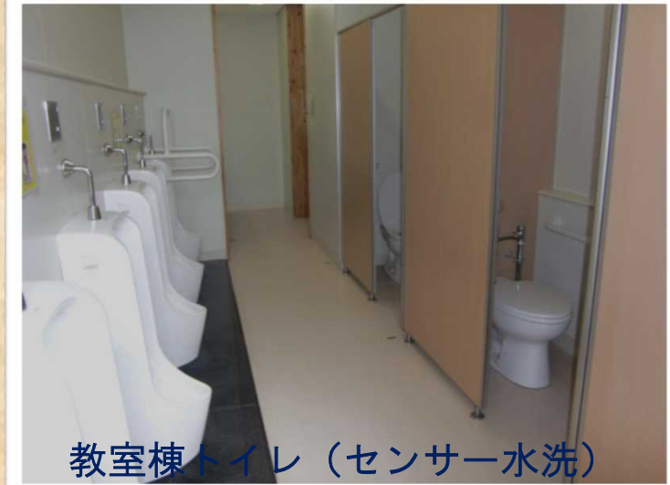
教室棟トイレ（センサー水洗）