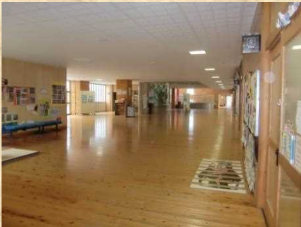
職員室・児童玄関前ホール