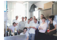
パリのパティスリー(洋菓子店)の仲間たちと