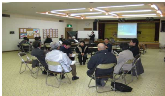
④個別ケース検討会議による関係機関の連携

特別支援教育，いじめ，虐待等をテーマに子ども・若者支援について子育て講演会の開催。年間5回程度。家庭教育支援を行う人材の養成も兼ねる。