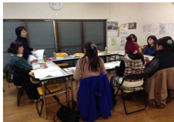
『スタッフ養成講座風景』