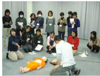
救急救命法（赤十字 幼児安全法）も実習