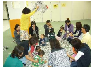
おんぶにだっこ…等 集団託児実習