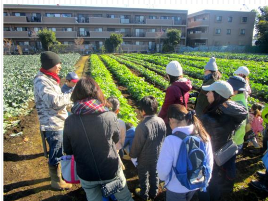
▲「大蔵大根を収穫体験！親子で学ぶみたかの農業」