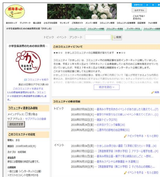
▲「小学生保護者のための家庭教育支援コミュニティかきしぶ」トップページ

平成20年9月、＜地域SNSが家庭教育支援において有効な媒体となりうるか＞についての実証実験的な調査研究（文部科学省委託事業）を行うことを目的に活動を開始。みたか地域SNS「ポキネット」に、「小学生保護者のための家庭教育支援コミュニティかきしぶ」を開設し、小学生の家庭教育や家庭生活に関するあらゆる事（しつけ、放課後や休日の過ごし方、習い事、おこづかい等）について、自由に情報交換・交流できる場を運営しました。活発な情報交換が行われ、これをきっかけに対面交流につながるなどの成果が得られたため、調査研究事業終了後も引き続き地域SNSを母体として活動を続けることとなりました。