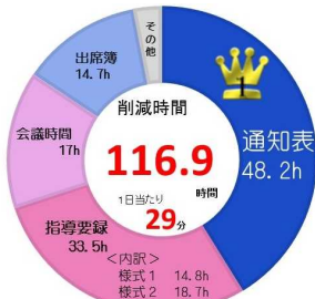
システムの活用により削減された時間数

モデル実践校教職員へのアンケートの結果、年間平均116.9時間(1日当たり29分)の校務負担が削減された。中でも、システム導入前に実施したアンケートで「特に負担を感じている」との回答が多かった通知表作成に係る時間が48.2時間、指導要録作成に係る時間が33.5時間と大幅に削減されている。