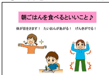
出前授業指導用資料より抜粋

◎平成28年3月、HPの食育コンテンツをリニューアルし、規則正しい生活習慣の大切さと「早寝早起き朝ごはん」の効果をお伝えしています。リニューアル前と比べ3倍以上のアクセスとなりました。