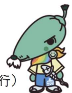
食育キャラクター しし十市朗