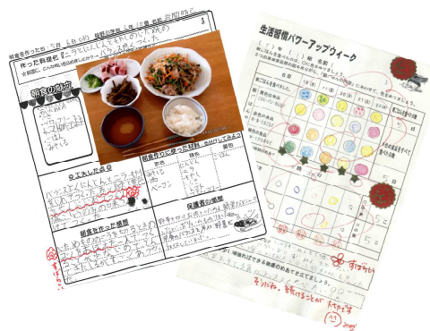
＜朝食の献立・パワーアップカード＞

今後は、保育園・小学校・中学校の連続性を図り、地域と一体となった取組をより一層推し進めていく。