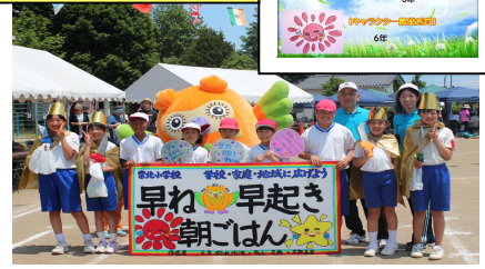
ポケットティッシュのデザイン

『早寝・早起き・朝ごはん』は児童の合い言葉になっている。早寝ができていない児童も増え、活動の成果が出ている。今後は、早寝ができない理由にテレビやゲームが挙げられているので、『早寝・早起き・朝ごはん』運動を基盤に、「アウトメディア」に力を入れていきたい。