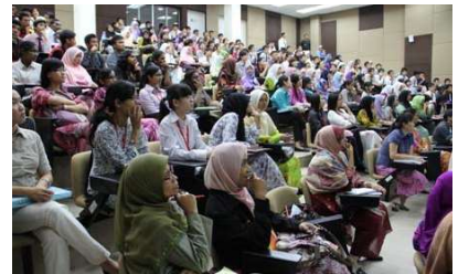
〈マレーシアの高校でのプロモーション活動〉

学士課程国際コースを中心とした学生リクルートのため、平成23年度は、受入重点国等13か国・地域の50以上の高校等でプロモーション活動を実施するとともに、日本学生支援機構や本事業推進事務局、福岡県留学生サポートセンター等が主催する海外での留学フェアに積極的に参加した。