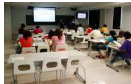
〈英語コース:講義の様子〉

平成22年10月に英語による授業のみで学位を取得できる9コースを新設し、現在、大学院経済学研究科、理学系研究科、工学系研究科、農学生命科学研究科、医学系研究科、新領域創成科学研究科、情報理工学系研究科、学際情報学府、公共政策学教育部にて約30の英語コースが開講している。また、24年度秋の学部英語コース開設に向け、準備を進めている。