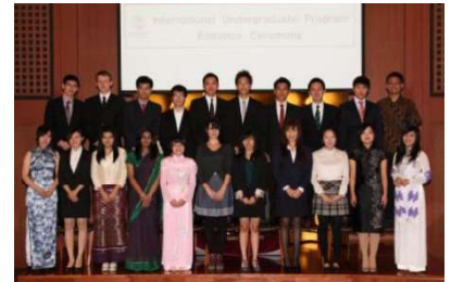
〈学部国際コース入学式〉

平成22年度10月に開設した学士課程国際コース(工学部・農学部)の第二期生として平成23年度は21人の留学生が入学した。また、大学院(学府)では、人文科学府、比較社会文化学府、医学系学府など7学府で新たに30コースを開講。(大学院では、平成24年秋までに、全17学府に57コースを開講する予定。)