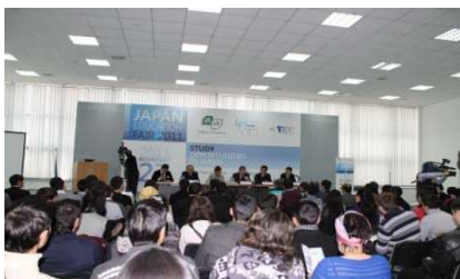
【「日本留学フェア2011」タシケント】

ウズベキスタン事務所を活用し、日本・ウズベキスタン間の大学交流の促進を図るため、本学がホスト校となり平成23年11月に開催した。日本側からは国立、私立16大学のほか、文部科学省等が参加した。ウズベキスタン側からは各地域を代表する10大学のほか、ウズベキスタン共和国大統領府、中高等教育省等が参加した。