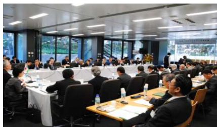
【日本・ウズベキスタン学長会議】