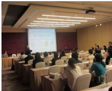
〈タイ・バンコクで開催された合同留学フェア〉