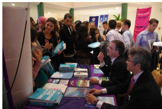
<日本留学説明会の開催 (平成23年11月、チュニジア・ハマメット)>