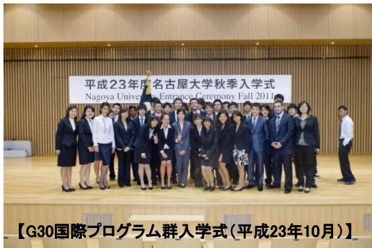
【G30国際プログラム群入学式(平成23年10月)】