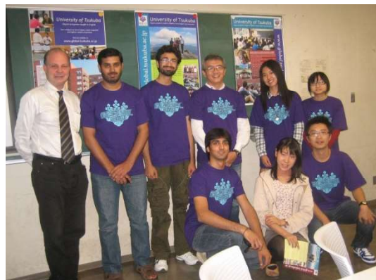
<平成23年度筑波大学学園祭にて、学生と教員による英語プログラムの紹介ブース>

○全国の大学の参加による日本留学説明会の開催;平成23年11月チュニジア、平成24年3月モロッコ