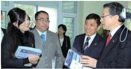
◀事務所についての説明を受ける中川文部科学大臣(当時)

2012年1月8日、中川文部科学大臣(当時)がベトナム国家大学ハノイを訪問され、VKCOのベトナムでの活動や役割についての説明を受け、その取組に理解を深めておられました。