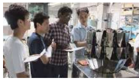
▲企業のエンジニアによる実演

農学研究科では、産業界との連携を深めるため、全11回、産業界から優れた農業をテーマにした講義を開講し、9社の民間企業から専門家を講師として招きました。