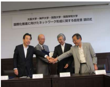
〈ネットワーク形成に関する協定書調印式〉