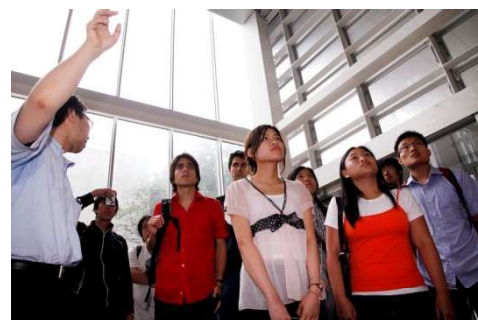
〈交流: IARUグローバルサマープログラムの様子〉

インド・バンガロールに海外大学共同利用事務所を設置し、平成24年2月に開所式を開催した。日本留学に関するワンストップサービスの提供、日本留学説明会等を行う。