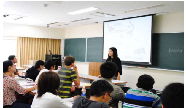
【G30国際プログラムの授業風景】

自己資金により、留学生宿舎を平成22年4月に新築(106室)、また平成23年9月に新築(93室)。宿舎には、生活支援アドバイザーを配置して、留学生の日本定着の支援を充実させている。