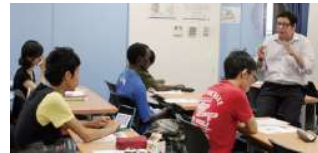
国際コースの授業の様子▶

本学唯一の学部コースである、工学部の国際コースでは、海外からの留学生と一般試験を経て分属された学生が席を並べて同じ教室で学んでいます。