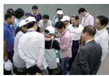
製品を囲んで研究者と談話する留学生 ▲

2011年9月28日、グローバル30に採択された京都の3大学(本学、同志社大学、立命館大学)が産業界との連携活動の一環として開催し、日本での就職に興味を持つ留学生達が、滋賀県内に工場がある計量機器メーカーおよびシートベルト業界大手メーカーの2工場を見学しました。