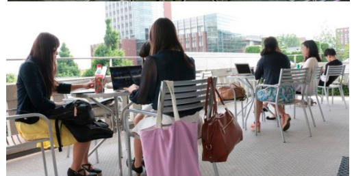
コーヒーを飲みながら統計について学ぶ、ランチタイムガイダンスの様子(左)、目的や人数に応じて自由に選択できるよう、様々な形状のスペースに様々な什器や ICT 設備を配置(右上)、屋外テラススペース(右下)