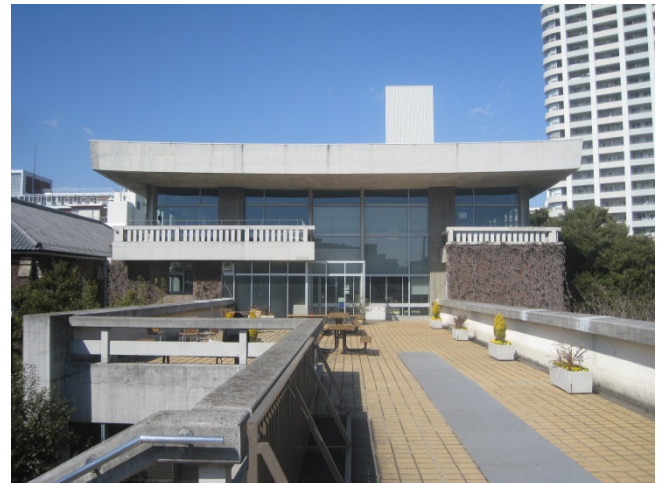
2階エントランスにつながるテラスからみた外観