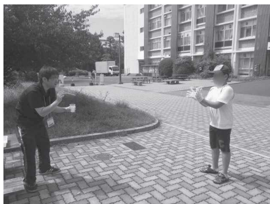
児童と支援者のかかわり合い