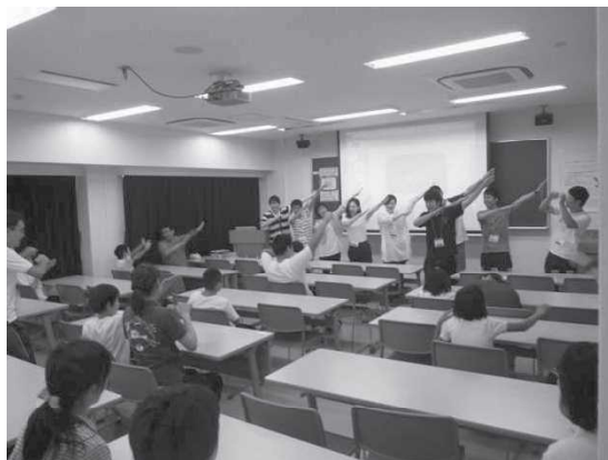
「わくわくサイエンス」の唱和