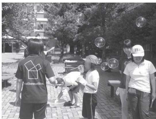
シャボン玉づくりに集中する児童