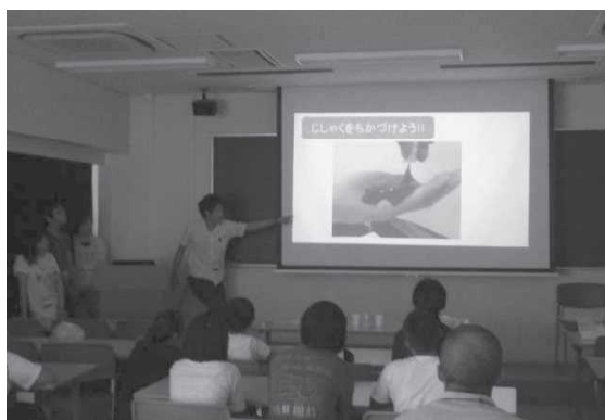
画像を効果的に利用した方法の説明