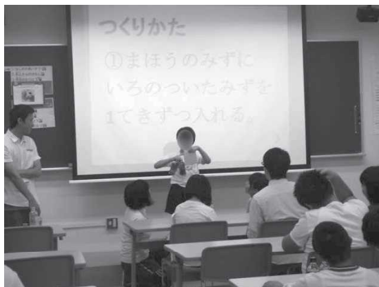
作成した人工イクラを使って発表する児童