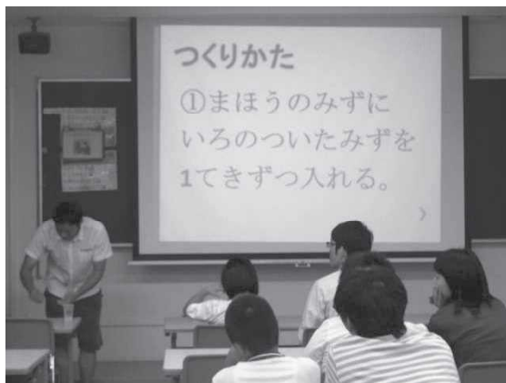
クイズを利用した導入