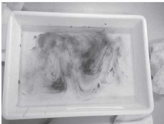
児童がつくった模様の事例