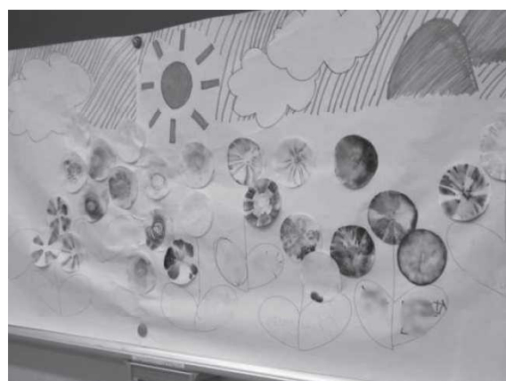
児童の実験結果を一つにしたお花畑