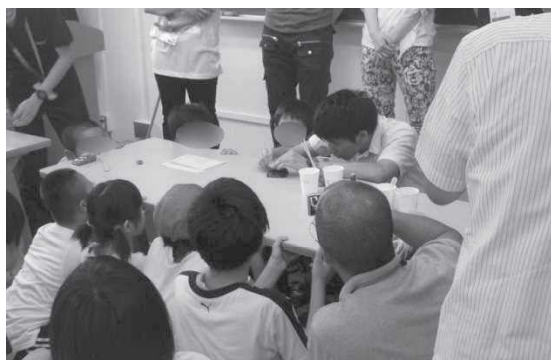
演示を伴う方法の説明