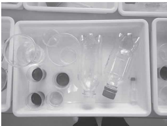
一人ずつに分けた材料の準備