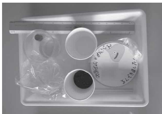
一人ずつに分けた材料の準備