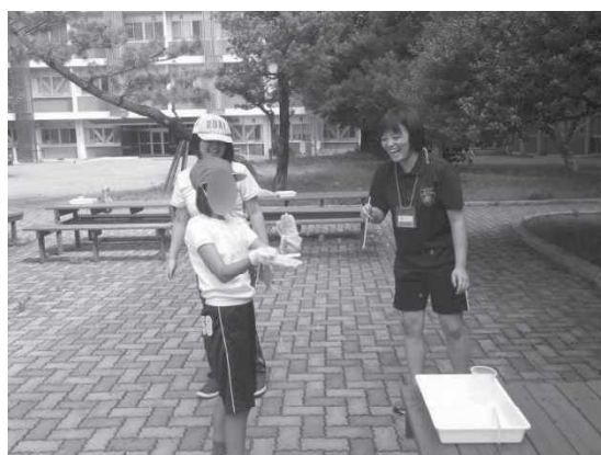
児童と支援者のかかわり合い