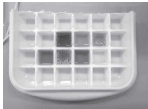
製氷皿を利用した実験教具