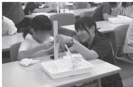
児童に対する個別の支援