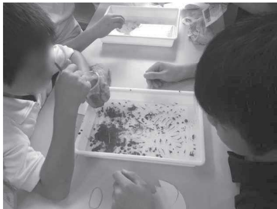
絵の具を垂らしている様子