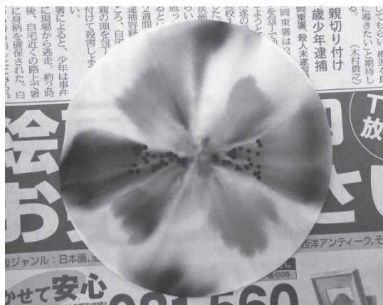
児童が行ったペーパークロマトグラフの結果