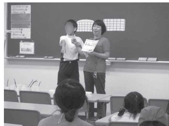
活動の振り返り（発表）