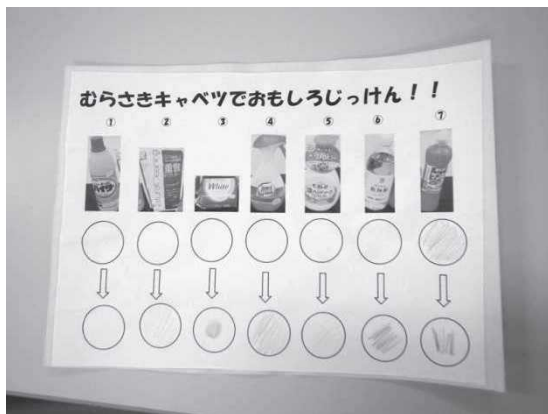
結果を記録するワークシート