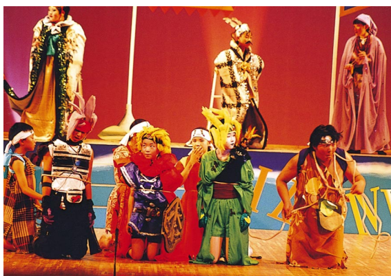
ミュージカルに出演する子どもたち

将来の文化立国を担う子どもたちの文化活動への参加や優れた芸術に身近に接する機会を充実させ，子どもたちが仲間との連帯感や物事を成し遂げた時に得られる達成感を味わうことを通じ，人と人とのつながりの大切さを知り，人を思いやる心を育てていけるよう，様々な取組を進めていきたいと考えています。