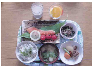
生徒が作った 朝ごはん

「食生活の大切さを私たちが呼びかけていきたい」という生徒の思いから、食生活改善推進委員ビーンズが組織された。全校生徒の食の実態をもとに、「クッキング教室」の企画と開催、「ビーンズ通信」の発行、「食のコーナー」への掲示資料づくりなど、わかりやすく楽しい活動を目指して取り組んでいる。