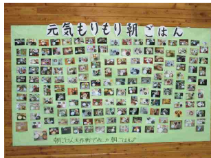
文化祭で 朝ごはんを紹介