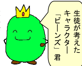
生徒が考えた キャラクター 「ビーンズ」君