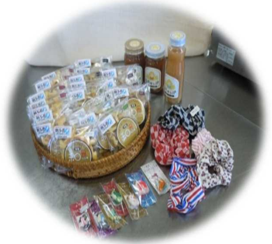
インターンシップ先で製造した製品