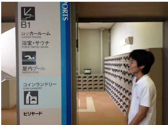
館内案内業務の様子

滋賀県にあるリゾートホテルのスポーツセンター受付業務および併設されているプラネタリウムの案内・操作に携わることにより、ホテル業で大切にされていることや留意点、マナーや接遇などお客様へのサービスがどのようになされているかを体験し、企業研究への視点につなげている。