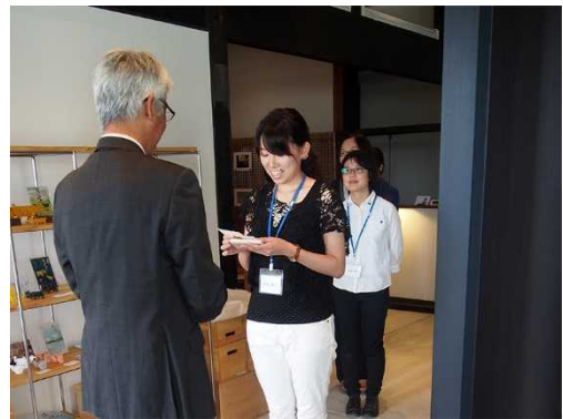
【商工会の方との名刺交換】