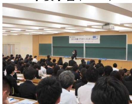
全体報告会の様子