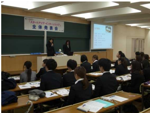
全体報告会の様子

金属板を加工する技術を活かして、試作から量産まで幅広く事業展開している会社で、事前に会社を訪問し、「社員インタビュー」を2度行い、その中で感じた企業の魅力を全体発表会で発表後、5日間の実習体験を行う。実習体験においては、社員の方の指導を受けながら、実際のモノづくりの現場での実習を行う。また、自身で設計した設計図に基づき、製品を製造する。※平成26年度:30名受講。