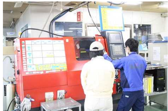
インターンシップの様子