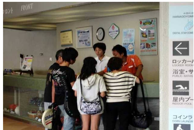
インターンシップの様子