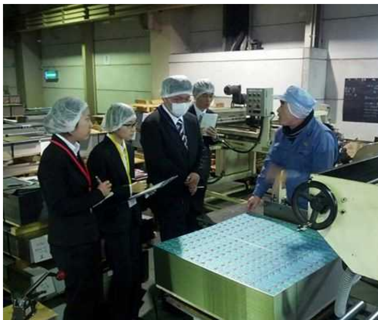
生産現場実習: 完成品までのプロセス

事前事後学習、企業内見学と社長による事業説明、通常業務、営業同行、生産現場での作業および新製品提案のプラン作成とプレゼンテーション。「インターンシップ科目」直後の週に「ビジネス実践演習Ⅰ」科目を受講し、企業の課題発見・解決プログラムで実習成果の応用実践へ展開する。