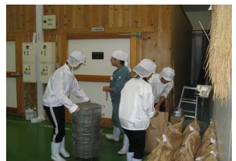
清酒醸造の実務体験

就業体験の目的がどのくらい達成できたかをふりかえり、学生同士がグループディスカッションで共有することによって内容を深め、将来の進路について目標設定する契機とする。