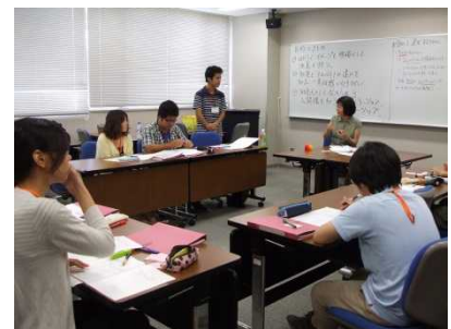
事前学習でのグループディスカッション