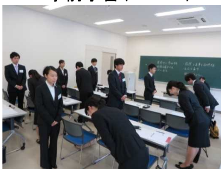
マナー研修の様子