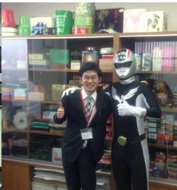
課題提案: 企業キャラクターのブランド化