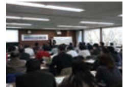
経営力向上セミナー