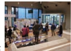
ビジネスサポート @広島市立中央図書館