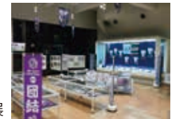
広島・川崎観光交流展