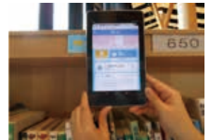
一部のタブレットでも利用可能