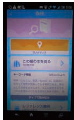
タッチタグの情報を表示した画面

書架などに設置されているICタグ(タッチタグ)にデバイスをかざすと、タグに表示したテーマと関連する書誌やレファレンス情報が表示される。