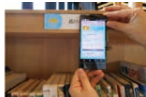
ICタグにタッチして情報を取得

書架等に設置したICタグをスマートフォンなどのデバイスで読み取ることにより、蔵書データとインターネット情報の一元的な検索を可能にしたシステム(カーリルタッチ)を全国で初めて本格導入した。