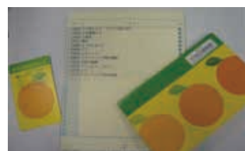
読書記録が記帳できる読書通帳