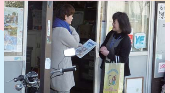
家庭訪問による子育て情報紙の配布

地域とうまくつなげられず、不安や課題を抱えている保護者に対しては、家庭訪問等により個別の相談にのったり、学びの場や地域への参加を促す取組を行っています。