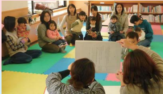
子育てサロンでの紙芝居

企業や NPO・地域ボランティアなど地域の力を借りて、親子で参加出来る様々なイベントや体験活動などを行い、地域とのつながりの中で家庭教育ができる環境づくりを行っています。