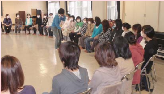
入学前の保護者向け講座

子育て・家庭教育の情報や知識を届けるだけでなく、他の保護者との出会い・交流の中で、自ら「学び、育つ」ための機会の提供を行っています。