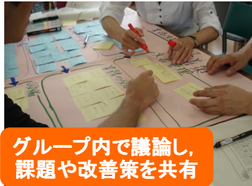
グループ内で議論し、課題や改善策を共有