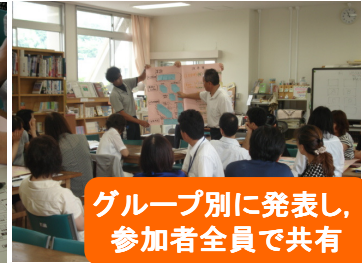
グループ別に発表し、参加者全員で共有